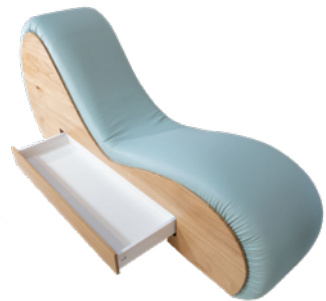
Bulle d'air 3500€