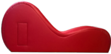
Amuse Bouche 2600€