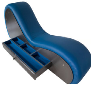
serrure à clé